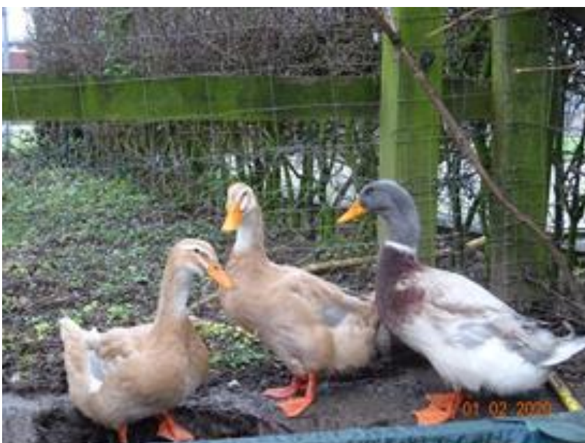
Geflügel Obmann Heiri Fallegger

Für die kommende Zuchtsaison 2024 wünsche Ich euch viel schönen Nachwuchs, vitale Tiere und hoffentlich zahlreiche schöne Ausstellungen.